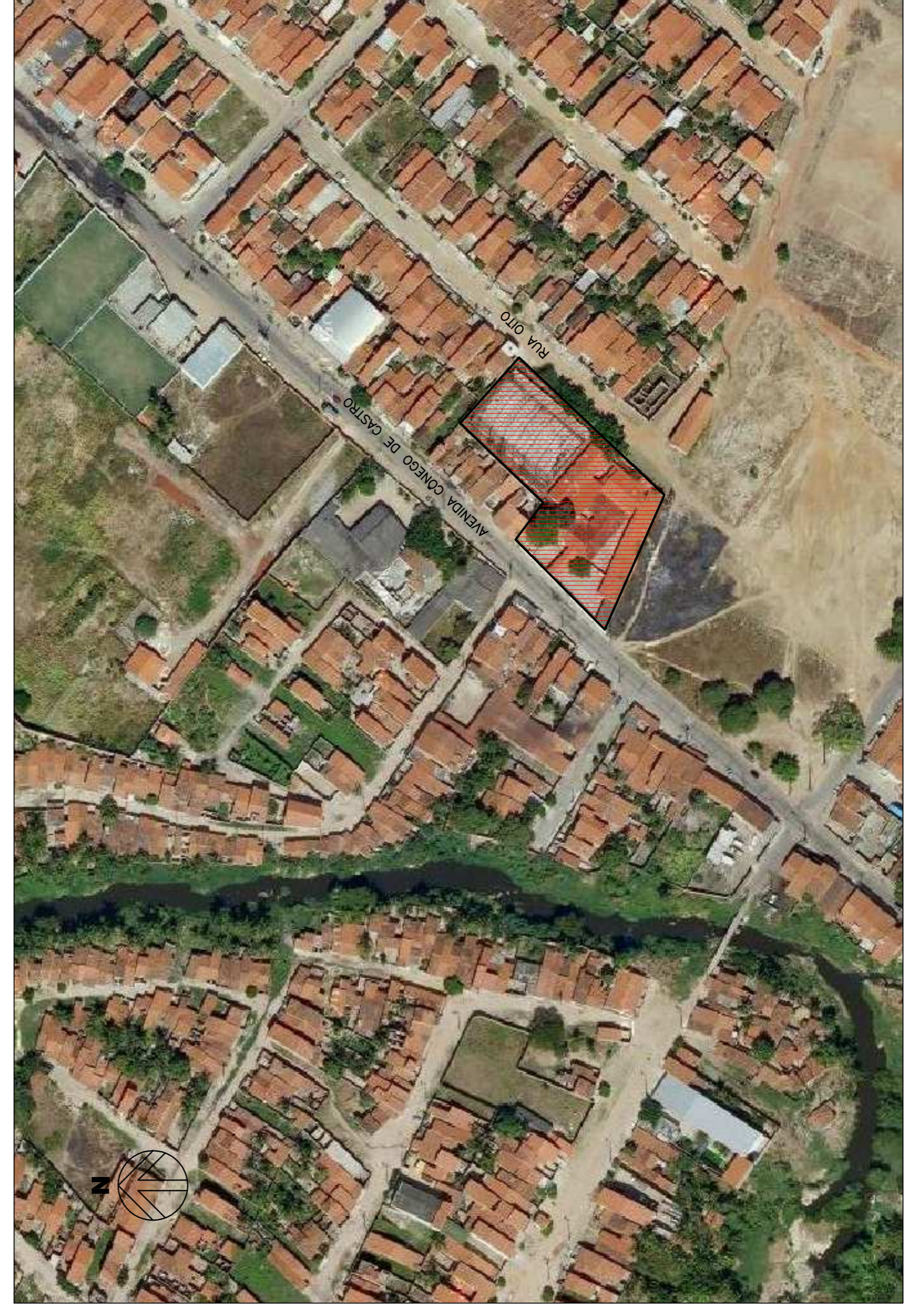
03 PLANTA DE LOCALIZAÇÃO SEM ESCALA

LEGENDA ÁRVORES EXISTENTES A SEREM PRESERVADAS